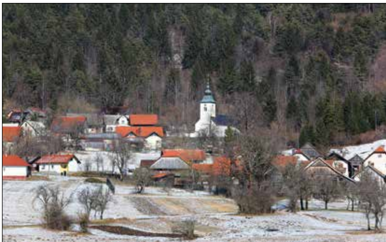
V štiridesetih hišah živi osemdeset prebivalcev - kako drugačna slika je bila leta 1931, ko je Bezuljak štel kar 265 duš!